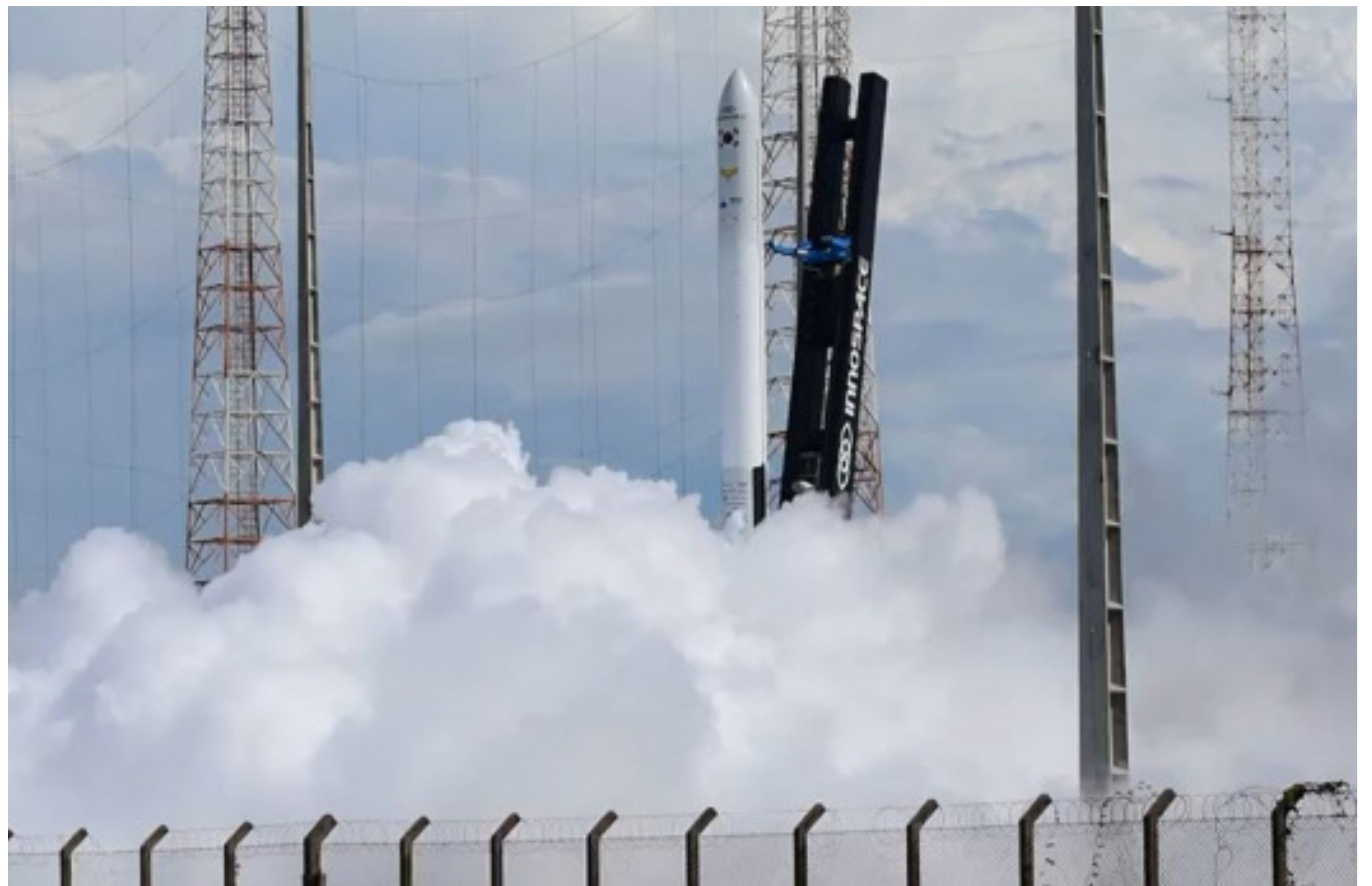
2021년 디캠프 투자 및 디데이 출전 스타트업 이노스페이스, 브라질 알칸타라 우주센터에서 국내 첫 민간발사체 '한빛-TLV'의 발사